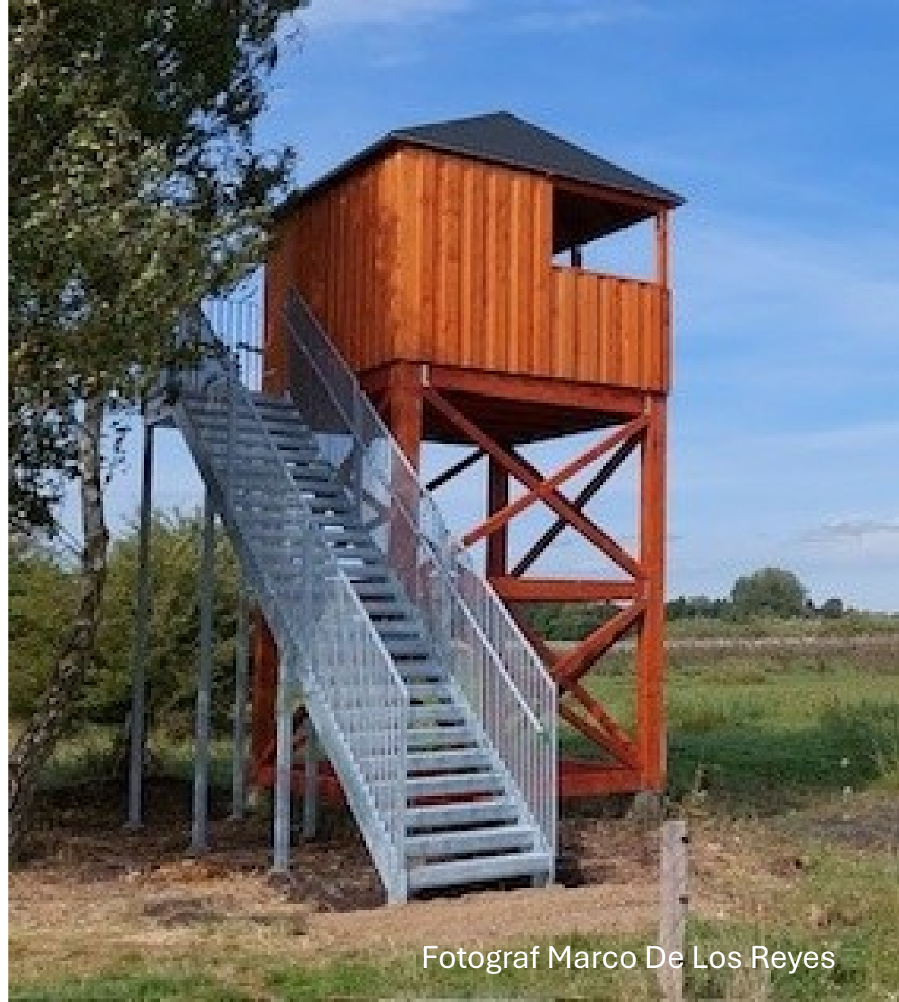
Fotograf Marco De Los Reyes

Det sker torsdag den 16. januar 2025 kl. 1900 i bibliotekets åbne sal.